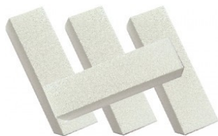
4. korak: blok gobica

Nasvet: Tudi brivski čopič lahko tukaj dobro opravi svojo nalogo.