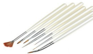
5. korak: komplet čopičev