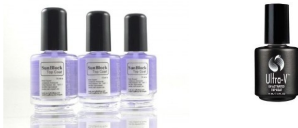
27. korak: Sunblocker in UV Top Coat

Pri utrjevanju nohtov nastane na površini lepljiv sloj, takoimenovan disperzijski film, ki ga odstranimo z vatico, prepojeno s čistilom. Pomembno je, da odstranimo ta lepljiv sloj v celoti. Če razpolagate s Sunblockerjem in Top Coat-om je sedaj čas za nanašanje teh sredstev. Pustimo, da se dobro posuši.