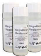
2. korak: odstranjevalec laka za nohte