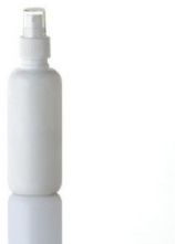
1. korak: dezinfekcijski sprej

Lak odstranimo z vatico prepojeno z odstranjevalcem laka za nohte. Odstranjene morajo biti vse sledi laka.