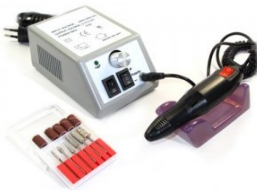
23. korak: Frezer – brusilni strojček

S frezerm se čistijo naravni nohti od spodaj. Tukaj moramo biti pazljivi: Najprej ne smemo popiliti celotnega naravnega nohta, drugič ne smemo poškodovati nohtne posteljice. Potem gladko spodnjo površino nohta polepimo. To naredimo s pomočjo lesene modelirke. Lepilo nanesemo in ga razmažemo s palčko. To pomeni večjo obstojnost nohta in lažje odstranjevanje umazanije, ki se nabira za nohtom.