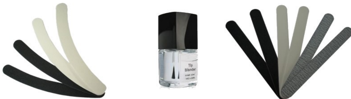
10. korak: (banana in ravne) pile ter tekočina Tipblender (Lineout)

Nasvet: Precej časa pri piljenju nam prihrani posebno sredstvo Tipblender/Lineout, ki ga nanese na prehod med naravnim nohtom in konico. Sredstvo plastično konico omehča in piljenja je za več kot polovico manj.