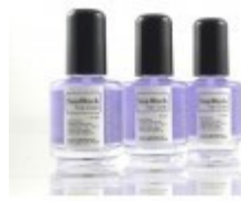
27. korak: Sunblocker in UV Top Coat