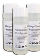
2. korak: odstranjevalec laka za nohte