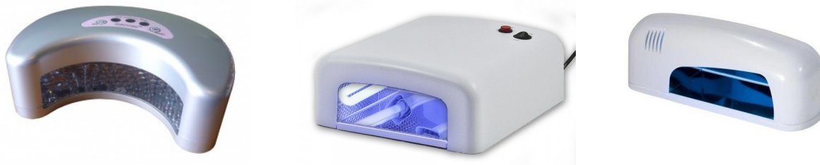
korak 15, 17: za utrjevanje UV gela imamo v ponudbi široko paleto UV lučk različnih moči

Nasvet: Medtem, ko modelirate eno roko, lahko gre druga roka že v lučko na utrjevanje.