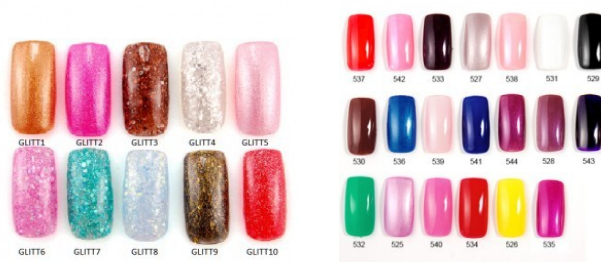
29. korak: velika izbira LNC UV permanentnih lakov

Nasvet: Modelirane nohte lahko lakiramo z permanentnimi UV laki.