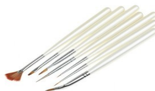
5. korak: komplet čopičev